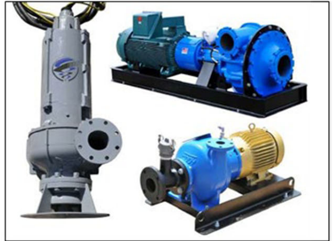
*Imagen de Despliegue Típico. Las bombas de Dragado pueden ser desplegadas horizontalmente o verticalmente. Fotos referenciales. Contáctenos para más información.